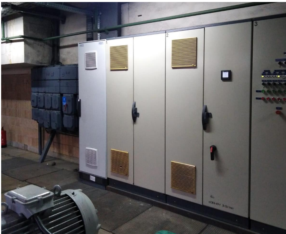
Zdjęcie nr 1 – istniejące szafy zasilająco-sterownicze. Widok elewacji.