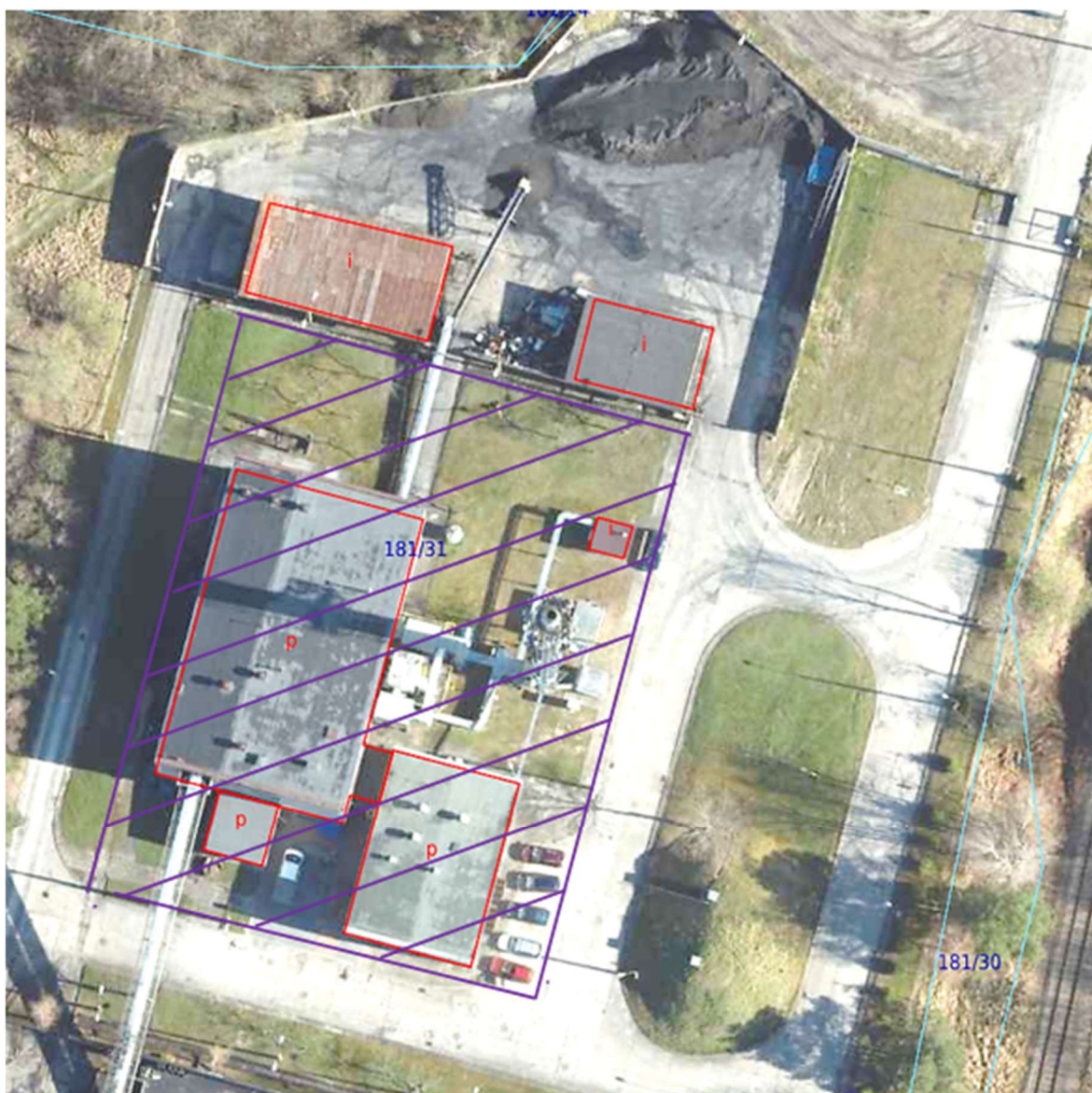
Rysunek 2 Obszar objęty Zadaniem Inwestycyjnym wewnątrz wieloboku oznaczonego fioletową linią ciągłą.

Teren działki nr ew. 181/4 w Kartuzach zabudowany jest budynkiem Ciepłowni wraz z niezbędną do funkcjonowania infrastrukturą. Teren działki nr ew. 181/4 w Kartuzach ma bezpośredni dostęp do drogi publicznej – ul. Franciszka Sędzickiego w Kartuzach.